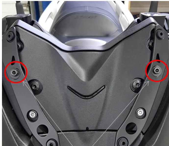
Location of the screws to replace